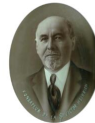
Les années 30