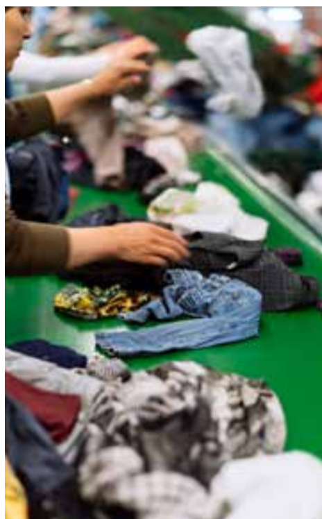
Grâce à ses 1 600 bornes de collecte réparties en Alsace, Relais Est tri chaque année près de 7000 tonnes de textiles

Année anniversaire pour le Relais Est qui souffle cette année sa 30 ème bougie. Collecte, tri et valorisation de textiles de seconde main sont la raison d'être de cette entreprise d'insertion. Une entreprise qui a choisi de diversifier ses activités, mais avec, pour fil rouge toujours, la création d'emplois et la réduction des déchets textiles.