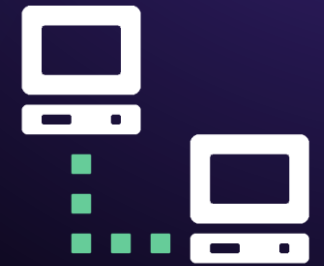
Réseau (Routeur, Switch, Wifi, Téléphonie)