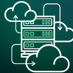
Cloud (Hybridation, Externalisation, Stockage)