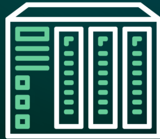
Serveurs (Virtualisation, Windows, Vmware, Stockage)