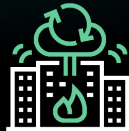
Sauvegarde (Externalisation, PRA)