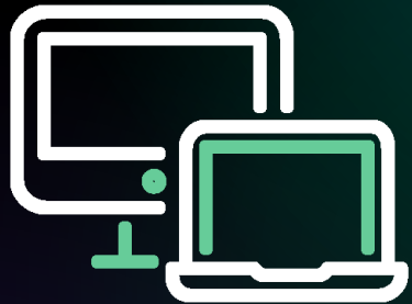
Ordinateurs (Fixe, Portable, Station)