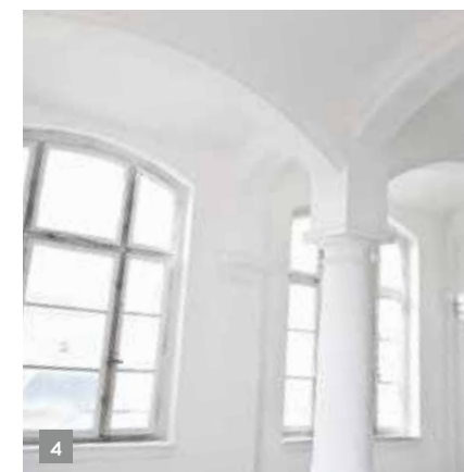
Collège 1 2 3 École des avocats de Strasbourg 4 École de chimie de Mulhouse 5