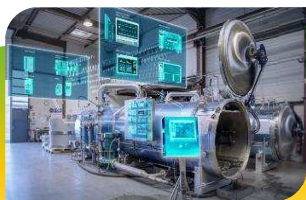
Autoclaves Air-Vapeur, Aspersion, Immersion, Dual et Bi-process