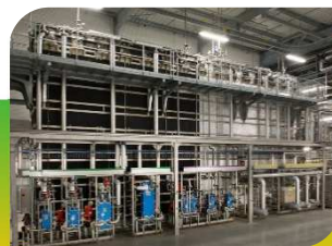
CHP/CHS Pasteurisateur et Stérilisateur Hydrostatique continu avec contrepression