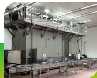
CMP Pasteurisateur Modulaire Continu sans contrepression

Pour plus d'informations veuillez CLIQUER sur chaque produit