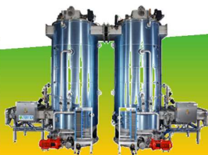
Serial Tower Système continu compact avec contrepression